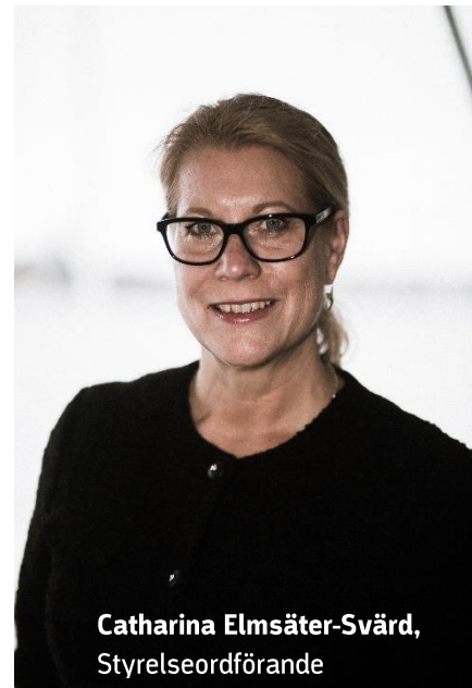
Catharina Elmsäter-Svärd, Styrelseordförande