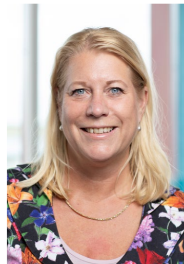
Catharina Elmsäter-Svärd Styrelseledamot, invald 2016