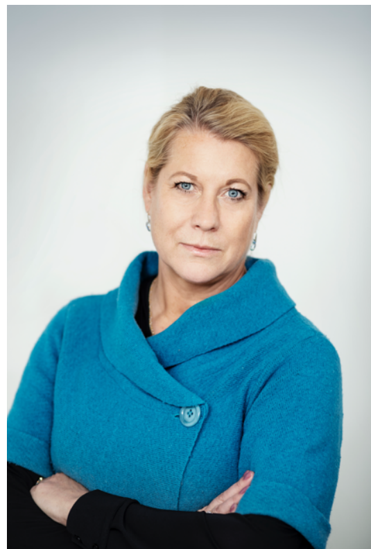
Catharina Elmsäter-Svärd Styrelseordförande

Catharina Elmsäter-Svärd Styrelseordförande, Railcare Group AB